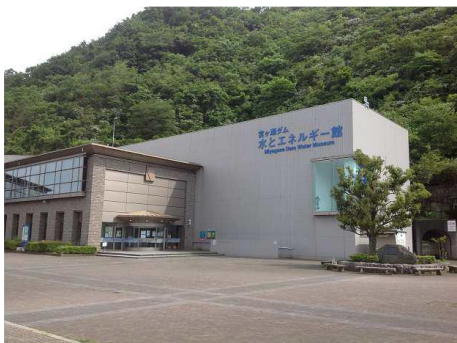
宮ヶ瀬ダム水とエネルギー館

リニューアルオープン当日のみ、先着順で記念品を配布します。 なお、数に限りがございます。予めご了承ください。