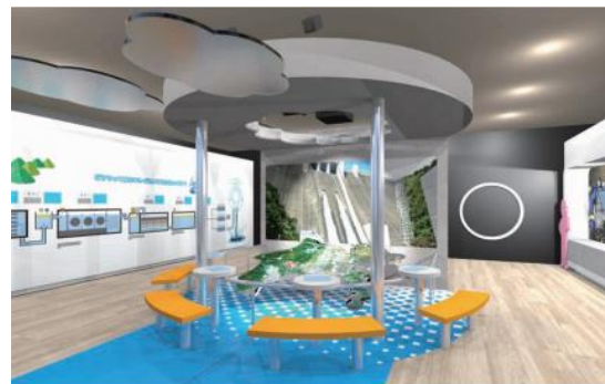
水道ゾーンリニューアル（イメージ）