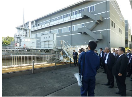
沈砂池の見学。台風のため、原水の濁度が高く池の水も濁っています。