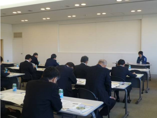
当企業団の概要、社家取水管理事務所・広域水質管理センターについて説明。

10月26日（木）に、福岡地区水道企業団の議会議員・監査委員の方々が当企業団の社家取水管理事務所・広域水質管理センターに視察にいられました。福岡地区水道企業団は福岡都市圏への水道用水供給事業を行っており、当企業団の概要・業務・施設を紹介しました。