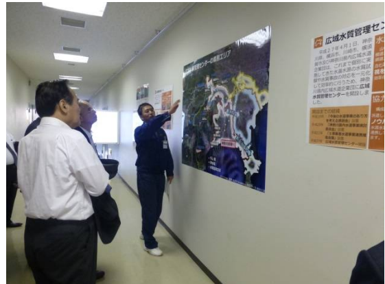
広域水質管理センターの業務範囲の説明。神奈川県にわたり水源監視を行っています。