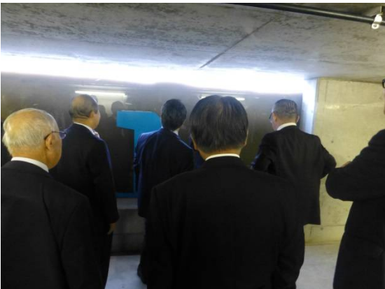
主魚道の見学。濁度が高く、濁っていましたが魚の遡上の様子が見えました。