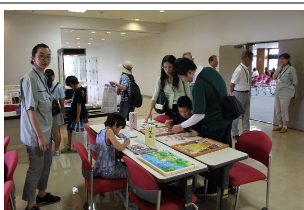
考古学財団のパズルコーナー