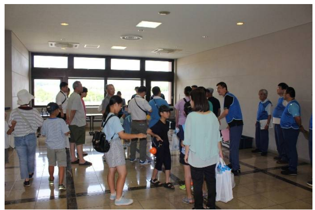
施設見学案内の集合場所