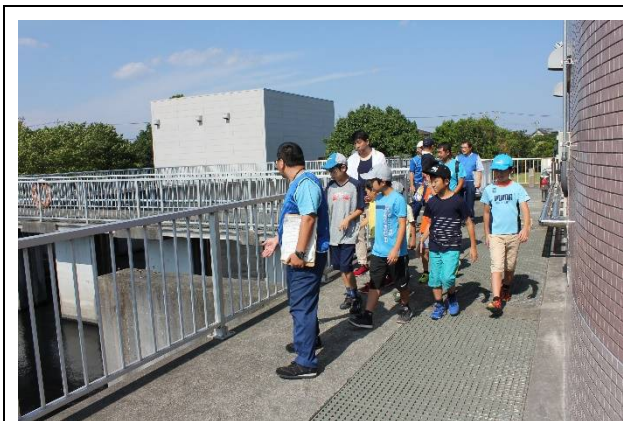
見学ツアーの様子②