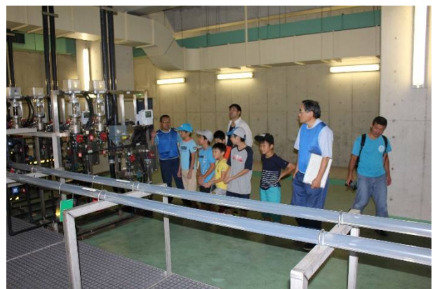
見学ツアーの様子①