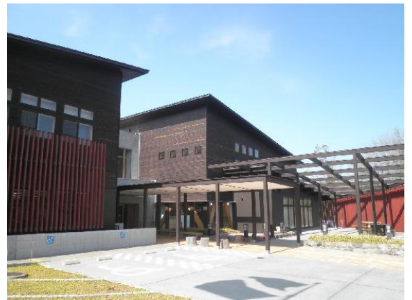
神奈川県自然環境保全センター