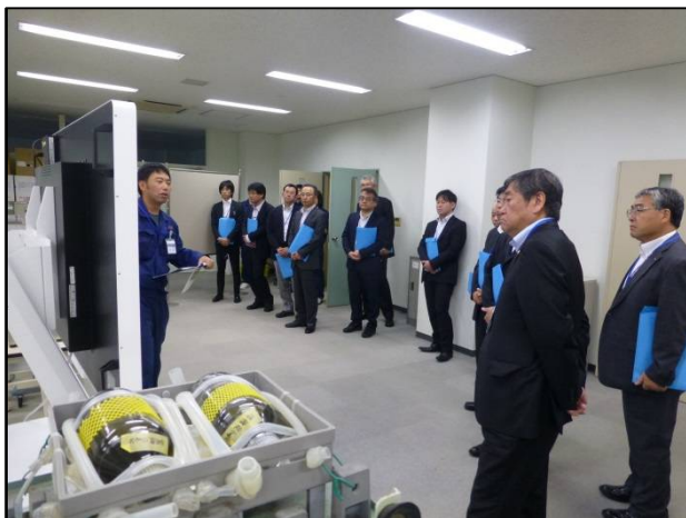
視察（ジャーテスト）