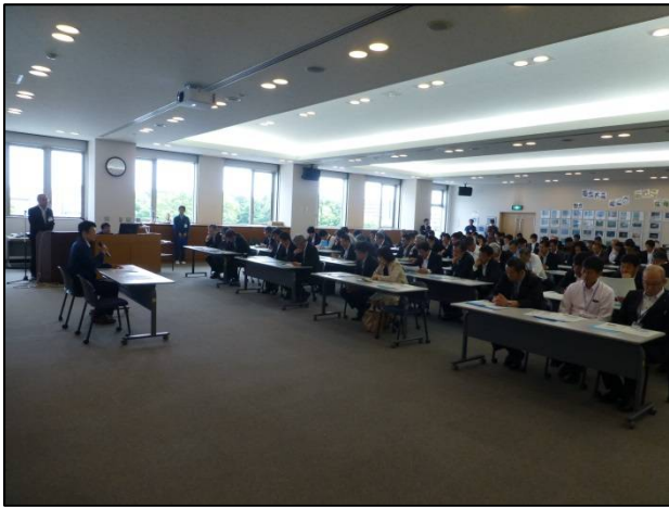
視察（社家大会議室）