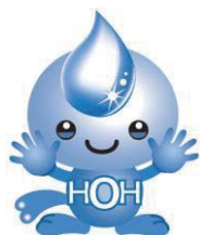
イメージキャラクター「ウォーターピー」